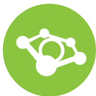
广告爬虫监测数据