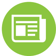
广告物料传输数据